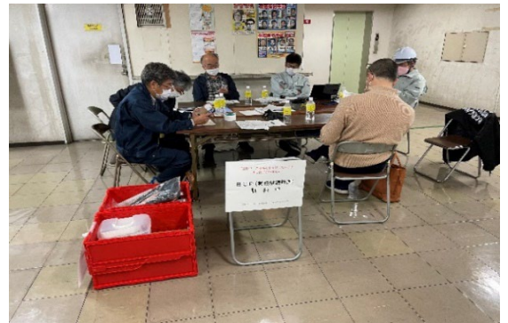
2022年 総合防災訓練 1F荷捌き場に初動対応拠点